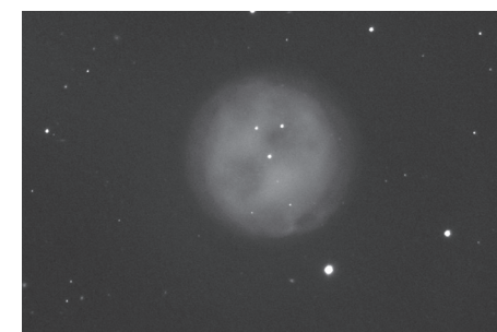
Soví mlhovina M97