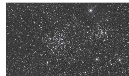
Otevřené hvězdokupy M38 a NGC 1907