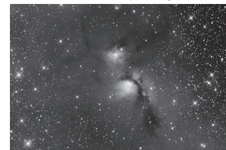
Reflexní mlhovina M78